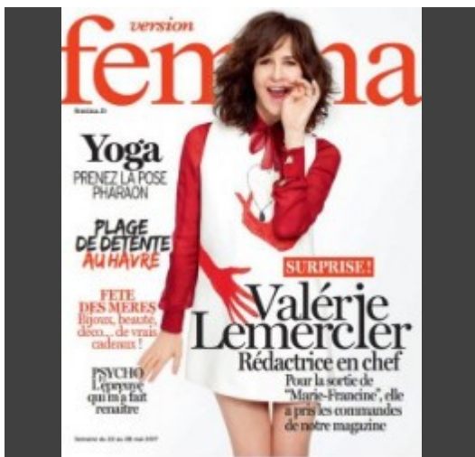
La Provence - version Femina du 20 mai 2017