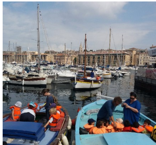
École des Moulins

Le bulletin d'adhésion 2017 est disponible en ligne, pensez-y avant d'embarquer ou de venir sur chantier.