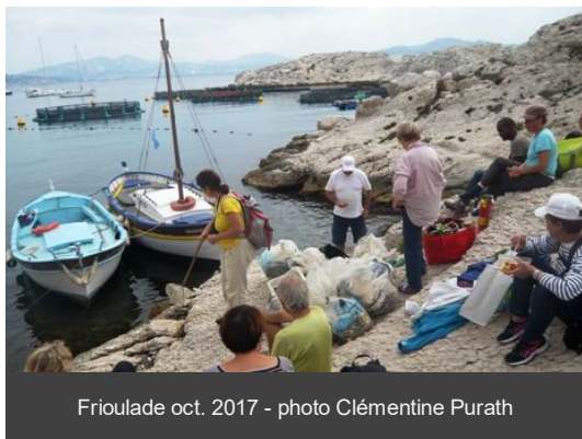
Frioulade oct. 2017