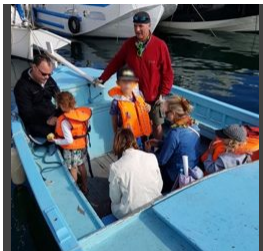
Journées européennes du patrimoine