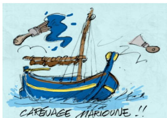
Dessin Damien Guévert