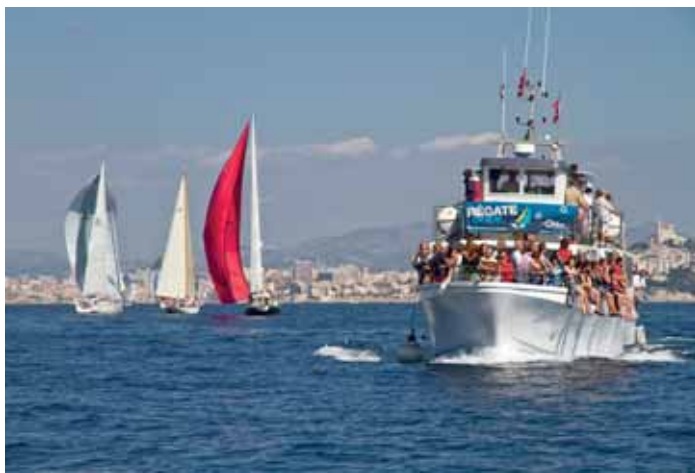
RÉGATE EN VUE

TARIF : 5 euros la séance - LIEU ET HEURE : CRDP, 31 bd d'Athènes 13001 Marseille à 19h - INFOS : Cinémathèque de Marseille - TELEPHONE : 04 91 50 64 48 - SITE WEB : http://www.cinemathequedemarseille.fr/