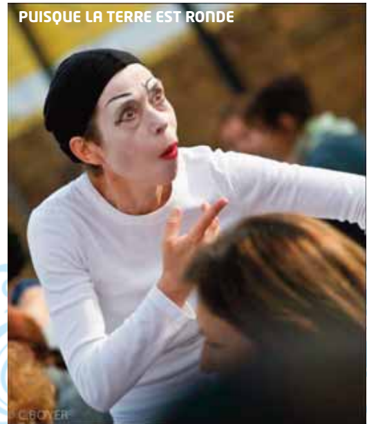
PUISQUE LA TERRE EST RONDE

TARIF : Vieux Port : Adulte 6 euros, - de 12 ans 3 euros / Vallon des Auffes : Adulte 10 euros, - de 12 ans 6 euros – inscription sur place - LIEU ET HEURE : RDV au stand Boud'mer en face de la mairie sur le Vieux-Port, de 10h à 16h - INFOS : Boud'Mer - TELEPHONE : 06 15 07 06 90 - E-MAIL : contact@boudmer.org - SITE WEB : www.boudmer.org