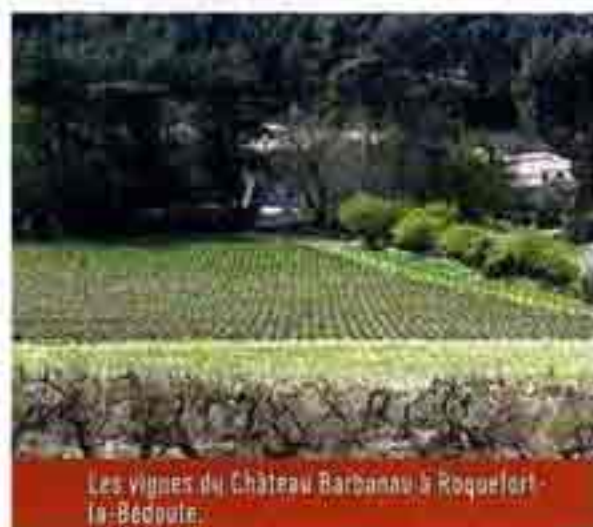
Les vignes du Château Barbanau à Roquefort-la-Bédoule.

La Fontasse - 13260 Cassis - Tél. 04 42 01 02 72 - www.fvaj.org