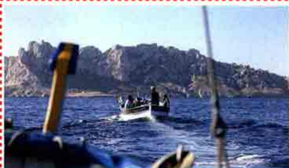
Même si certaines atteignent un âge respectable, les barquettes de l'association Boud'mer, soigneusement entretenues par une équipe de bénévoles, permettent de rejoindre l'île de Riou ou le phare du Planier.