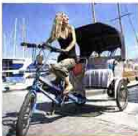
Les pousse-pousse à assistance électrique de Proxi-Pousse permettant de découvrir la cité phocéenne autrement, confortablement installée dans une banquette.

Rue Pite Pite Prolongée - Les Goudes - 13008 Marseille - Tél. 06 20 46 83 82 - www.raskas-kayak.com